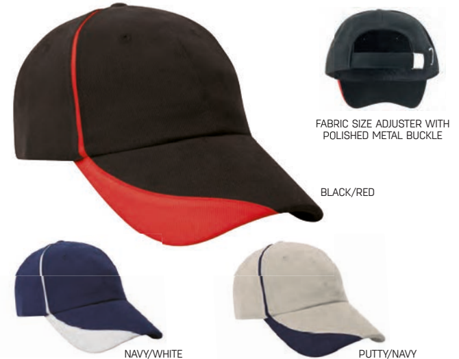
FABRIC SIZE ADJUSTER WITH POLISHED METAL BUCKLE

100% schwerer gebürsteter Baumwolltüll, 350g 6 teilig Unverstärkte Vorderseiten Vorgebogener Schirm Schirm und Verzierung in Kontrastfarben gestickte Luftlöcher Packinhalt 25 - Kartoninhalt 150