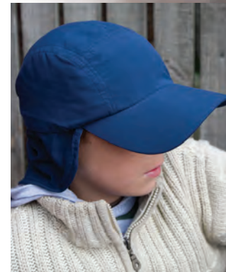
RC069J Junior Legionnaires Cap*