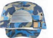
FABRIC SIZE ADJUSTER WITH ANTIQUÉ BRASS BUCKLE