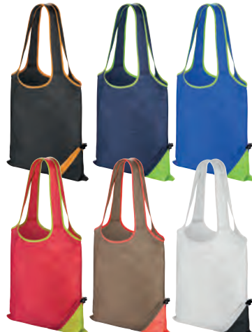
RASPBERRY/LIME FENNEL/PINK WHITE/BLACK

BLACK/ ORANGE NAVY/LIME ROYAL/LIME LIME/ROYAL