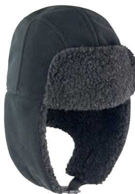
SNAP CLOSE ADJUSTABLE FASTENING