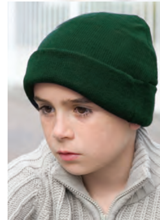
RC029J Junior Woolly Ski Hat