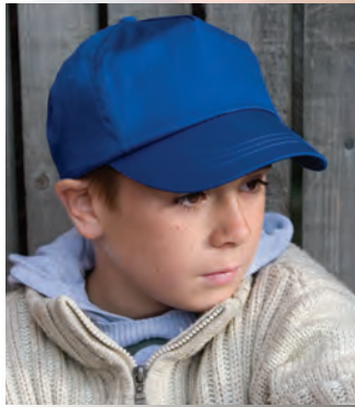
RC005J Junior Cotton Cap