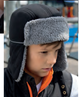
RC032J* Junior Ocean Trapper Hat