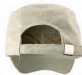
FABRIC SIZE ADJUSTER WITH BRUSHED METAL BUCKLE