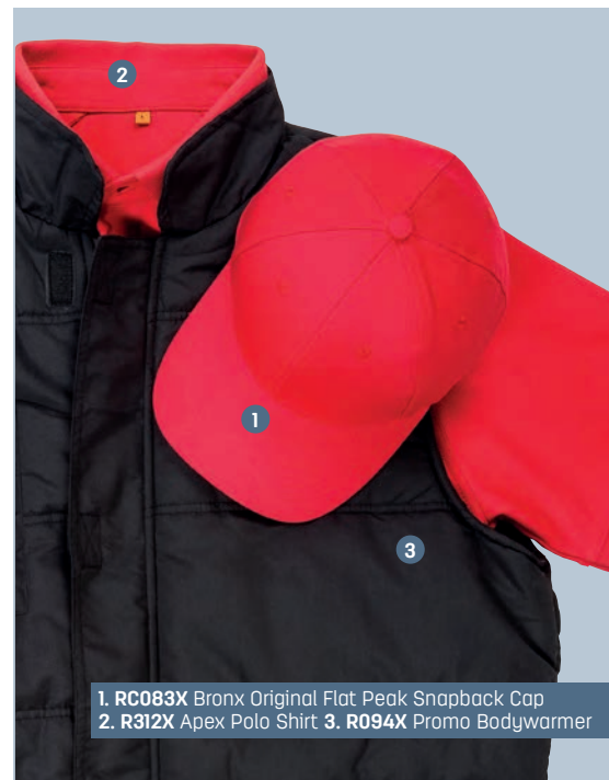
1. RC083X Bronx Original Flat Peak Snapback Cap 2. R312X Apex Polo Shirt 3. R094X Promo Bodywarmer

ID your look with our co-ordinated MIX AND MATCH system, ideal for a team or individual look.