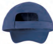
EASY TEAR RELEASE SIZE ADJUSTER