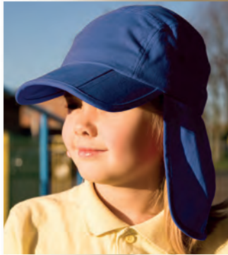
RC076J Junior Fold Up Legionnaires Cap