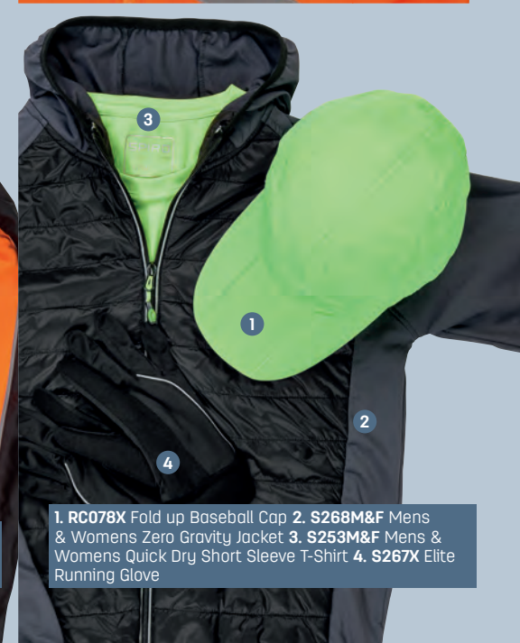
1. RC078X Fold up Baseball Cap 2. S268M&F Mens & Womens Zero Gravity Jacket 3. S253M&F Mens & Womens Quick Dry Short Sleeve T-Shirt 4. S267X Elite Running Glove