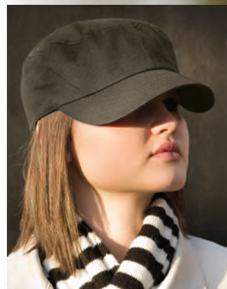
RC070Y Youth Trooper Lightweight Cap*