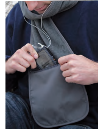
ZIP CLOSING POCKET