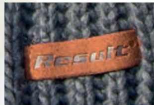
SOFT FAUX SUEDE RESULT® BADGE TO SCARF EDGE