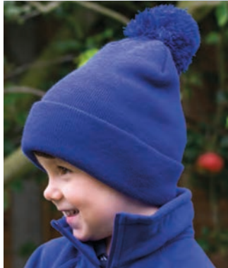
RC028J Junior Pom Pom Beanie