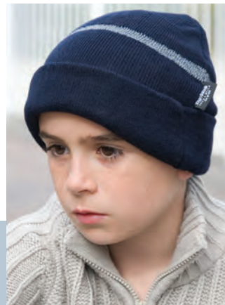
RC033J* Junior Thinsulate™ Hat with Reflective Woven Band