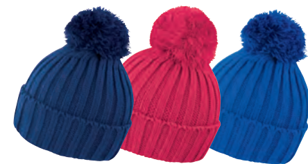
NAVY RASPBERRY ROYAL

100 % Polyacrylique Tricot épais Bonne longueur Bonnet à bord replié Extrêmement chaud Taille unique Qté Pack 25 - Qté Carton 150