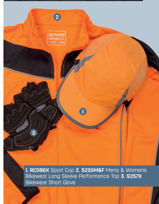
1. RC086X Sport Cap 2. S255M&F Mens & Womens Bikewear Long Sleeve Performance Top 3. S257X Bikewear Short Glove