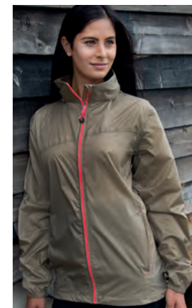
R189X matching jacket colourways