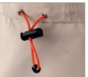
SHOCKCORD SIZE ADJUSTER