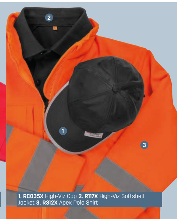
1. RC035X High-Viz Cap 2. R117X High-Viz Softshell Jacket 3. R312X Apex Polo Shirt